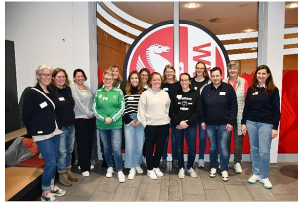
Gruppenbild TN 6. Leadership-Programm

Der Fußball- und Leichtathletik-Verband Westfalen e.V. lädt Sie ein, sich für das 7. FLVW Leadership-Programm für Frauen im Sport zu bewerben. Die Module werden alle im SportCentrum Kaiserau durchgeführt.