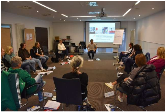
Workshop im FLVW